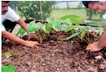
Figura 7. Desinfección de sustratos previa a la siembra.

En investigaciones realizadas en la DACA UJAT, se encontró la sensibilidad de las plantas de anturio al insecticida Parathion metílico, por lo que no se recomienda su uso para desinfección de sustratos o plantas de anturios. Lo anterior concuerda con lo reportado por Anthura® (2007) quien reporta efectos dañinos en Anthurium con pesticidas como Orthene y Parathion. Según experiencias en la DACA UJAT en el control de problemas fungosos en las plantas, se puede aplicar Captan® a una dosis de 3gr/litro o Ridomil Bravo® a una dosis de 1gr/litro, sin observar manifestaciones de toxicidad en las plantas.