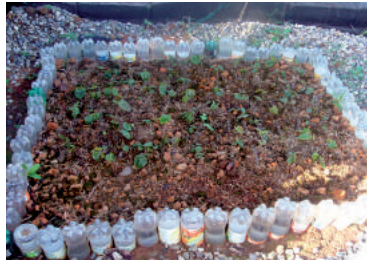
Figura 4. Resultados de ensayos de propagación por esquejes en DACA.

Particularmente, en Tabasco, han sido realizados ensayos por profesores investigadores de la DACA UJAT, probando sustratos para la brotación de esquejes de Anthurium andreaeanum en los que se encontraron excelentes resultados utilizando una mezcla de viruta fina de Bojón ( Cordia alliodora ) y trozos de aproximadamente 2 cm de diámetro de ladrillo rojo, en una relación de 1:1; por otra parte, se utilizó únicamente cascarilla de cacao seca y descompuesta. En ambos sustratos se obtuvieron excelentes resultados teniendo las primeras hojas en 25 días y plántulas promedio de 5 cm de altura en dos meses.