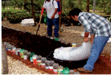
Figura 6. Hojas secas y cascarilla de cacao utilizados como sustratos.

Considerando las prácticas llevadas a cabo en el estado de Veracruz, que produce anturios a nivel comercial, es recomendable desinfectar los sustratos para evitar problemas sanitarios en el cultivo. Se puede hacer mediante la exposición del sustrato a vapor de agua por 20 minutos mediante una caldera rústica o mediante la aplicación de Dazomet® (Basamid G microgranulado) a una dosis de 250 a 300 g / m 3 de sustrato, este agroquímico se libera como un gas con propiedades insecticida, nematocida, fungicida y herbicida, lo cual lo hace práctico para esta actividad importante en el manejo de sustratos.