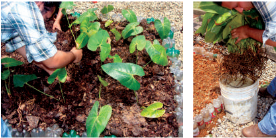
Figura 5. Siembra correcta y desinfección de hijuelos de anturios.

Como se mencionó anteriormente, en el estado de Tabasco se encuentran pocos ejemplares, propiedad de coleccionistas o amas de casa, quienes esperan que la planta madre emita hijuelos alrededor, los cuales son separados de aquélla y sembrados en un nuevo recipiente.