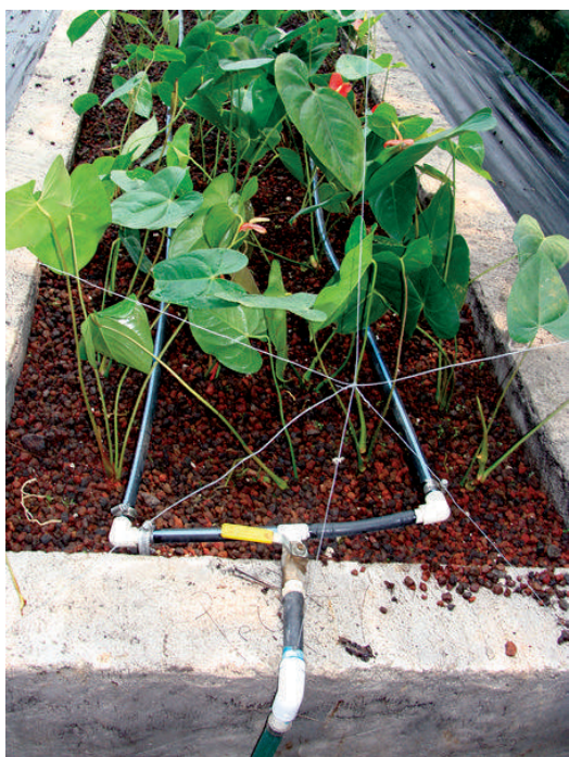
Figura 8. Diseño de siembra para el cultivo de anturios.