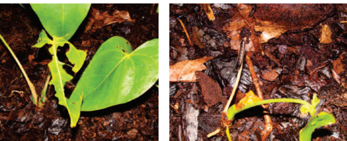
Figura 10. Hojas consumidas por larvas de lepidópteros.

En el caso de cultivos de Anthurium andreanum establecidos en la DACA UJAT, se presentó un ataque severo de larvas de lepidópteros que por la gravedad del caso y ataques nocturnos, no fueron identificadas con precisión y sus daños consisten en consumir totalmente las hojas tiernas dejando únicamente el pecíolo, el cual fue controlado con aplicaciones nocturnas con Cipermetrina ® a una dosis de 1ml/l agua.