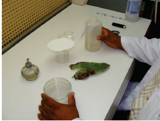
Figura 11. Colecta y observación de hojas enfermas en laboratorio.