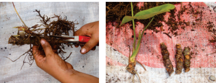
Figura 2. Poda de raíces y hojas de tallos adultos para extraer esquejes.

Actualmente no existen cultivos comerciales de esta especie en Tabasco; sin embargo, las plantas cultivadas de traspatio fueron introducidas de otros estados como Veracruz y Chiapas, donde se le propaga por esquejes cuando la planta es adulta y su tallo no se sostiene erecto debido a su crecimiento. Se realiza un corte del tallo en segmentos de 10 a 15 cm y se trasplantan para inducir a la producción de raíces y la emisión de brotes laterales dando origen así a nuevas plantas. Otra forma de propagación sencilla pero lenta, es la de cosechar y trasplantar los hijuelos que crecen alrededor de la planta madre.