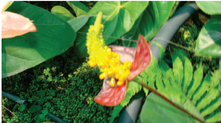
Figura 1. Frutos maduros de anturio ( Anthurium andreaeanum )

Este método de propagación no es muy común, por ser un método lento utilizado la mayoría de las veces para realizar cruces para la generación de nuevas variedades. En el estado de Tabasco no se tiene reporte de su utilización.