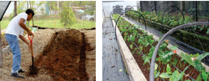
Figura 9. Construcción de camas de siembra.

Las camas pueden ser de 1.20 m de ancho por lo que se disponga de largo y con una profundidad de 30 cm. En el caso de cultivarse en maceta, se recomienda una profundidad de 12 a 17 cm para evitar que las plantas se alarguen o en caso contrario, no puedan sostenerse correctamente y su crecimiento sea lento. En macetas de 9 cm se pueden cultivar plantas hasta de 40 cm de altura.