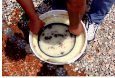
Figura 3. Desinfección en una solución fungicida- bactericida y siembra.