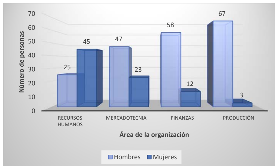
Figura 1. Total de la muestra.

En la figura 1, se aprecia cómo se integró el total de la muestra por 280 participantes. Es interesante observar que en el área de recursos humanos, predominan el género femenino con un 64%, en tanto que en mercadotecnia disminuye a un 33%, en finanzas constituyeron el 17% y en producción solo el 4%.