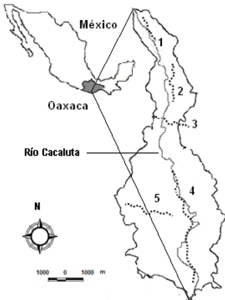
Figura 1. Localización de la zona de estudio y sitios de muestreo: El Hule (1), Las Palmas (2), El Arenoso (3), Cuenca Baja (4) y Xuchitl (5).

Figure 1. Location of the study area and sampling sites: El Hule (1), Las Palmas (2), El Arenoso (3), Cuenca Baja (4) y Xuchitl (5).