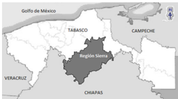
Figura 1. Localización de la región Sierra de Tabasco. Figure 1. Location of Tabasco's Mountain Region.

corresponde a su parte serrana (INE-SEMARNAT 2000), así como ortofotografías aéreas de la Sierra de octubre del 2000. Para la verificación de coberturas se fotointerpretaron imágenes del programa Google Earth (Google Earth. Image®2005 Digital Globe) y se ocupó un sistema de información geográfica (S.I.G.) con capas vectoriales de la cobertura de vegetación y uso de suelo de la Secretaría de Agricultura y Recursos Hidráulicos (1994).