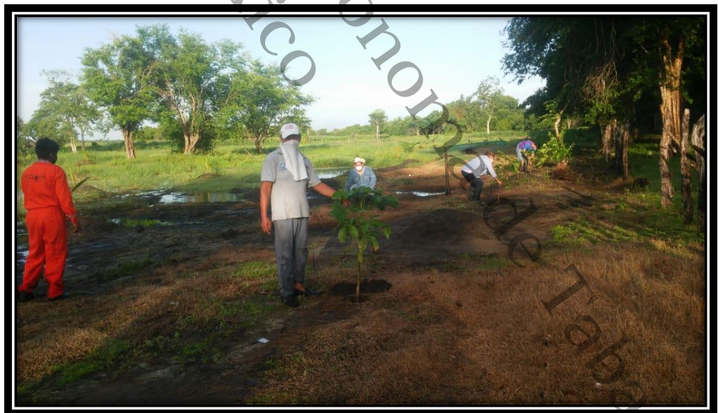
imágenes aplicadas a la reforestación de árboles frutales a familias campesinas de la localidad de Santa Cruz, Centla, Tabasco, 2020.