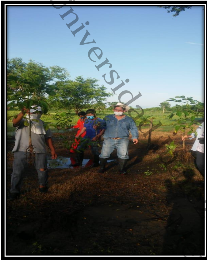
imágenes aplicadas a la reforestación de árboles frutales a familias campesinas de la localidad de Santa Cruz, Centla, Tabasco, 2020.