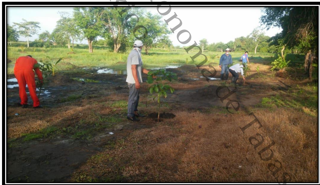
imágenes aplicadas a la reforestación de árboles frutales a familias campesinas de la localidad de Santa Cruz, Centla, Tabasco, 2020.