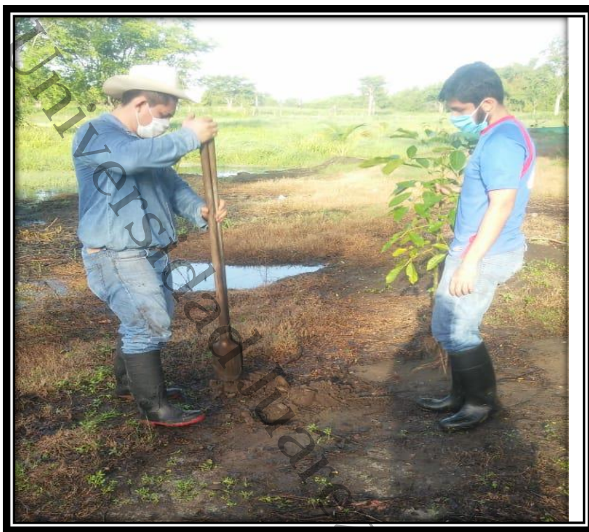
imágenes aplicadas a la reforestación de árboles frutales a familias campesinas de la localidad de Santa Cruz, Centla, Tabasco, 2020.