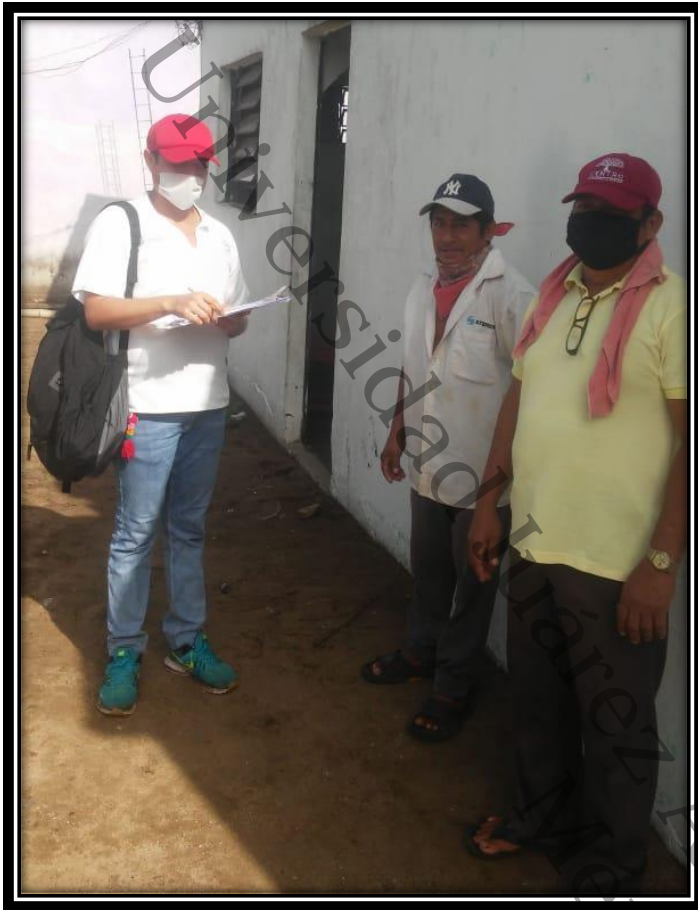
imágenes aplicadas a familias campesinas de la localidad de Santa Cruz, Centla, Tabasco, 2020.