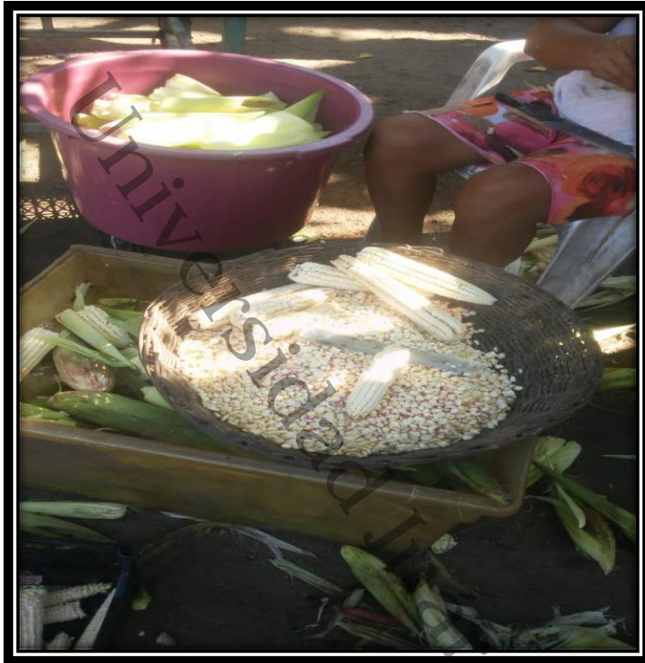
imágenes aplicadas a familias campesinas de la localidad de Santa Cruz, Centla, Tabasco, 2020.