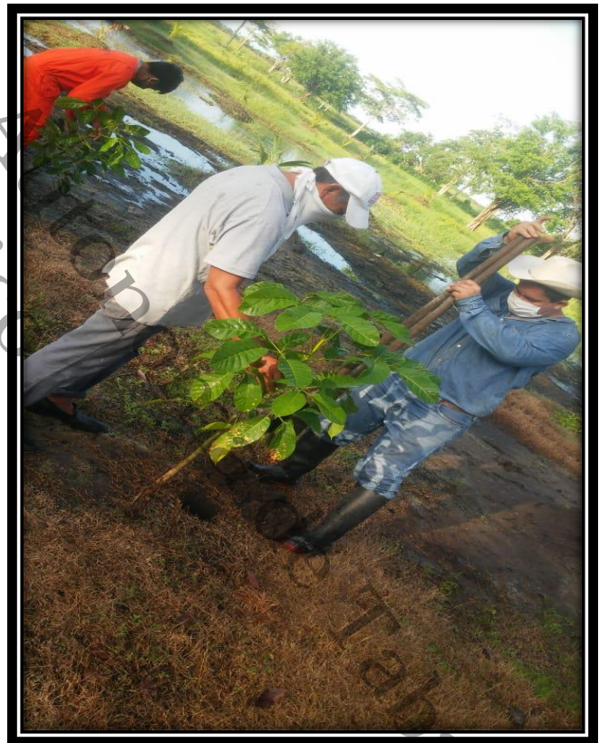
imágenes aplicadas a la reforestación de árboles frutales a familias campesinas de la localidad de Santa Cruz, Centla, Tabasco, 2020.