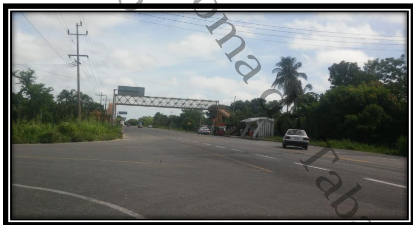
Fuente: Elaboración propia imágenes aplicadas a la carretera federal de la localidad de Santa Cruz, Centla, Tabasco, 2020.