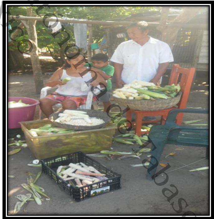
Fuente: Elaboración propia imágenes aplicadas a familias campesinas de la localidad de Santa Cruz, Centla, Tabasco, 2020.