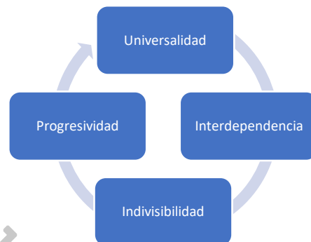
FIGURA 1. PRINCIPIOS CONSTITUCIONALES DE LOS DERECHOS HUMANOS