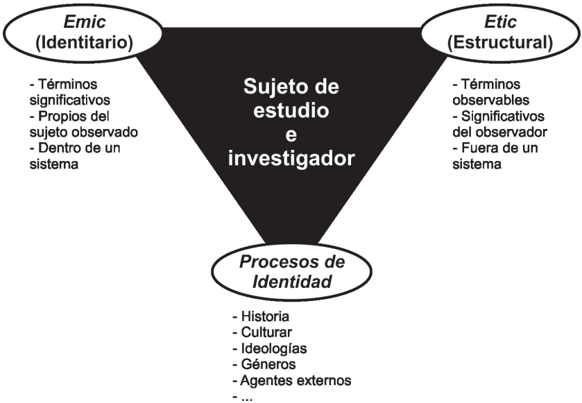
Figura 1. Etnografía multirreferencial del sujeto de estudio y del investigador (Muñoz Sánchez, P.; 2008).

sus implicaciones. Y a la vez, someter al propio observador al mismo análisis para descifrar los posibles resultados de la investigación que pueden estar influyendo sobre los resultados de la etnografía. En la ilustración siguiente, se representan ambas perspectivas trabajadas desde los protagonistas para concluir en la memoria colectiva y los procesos que les llevó: