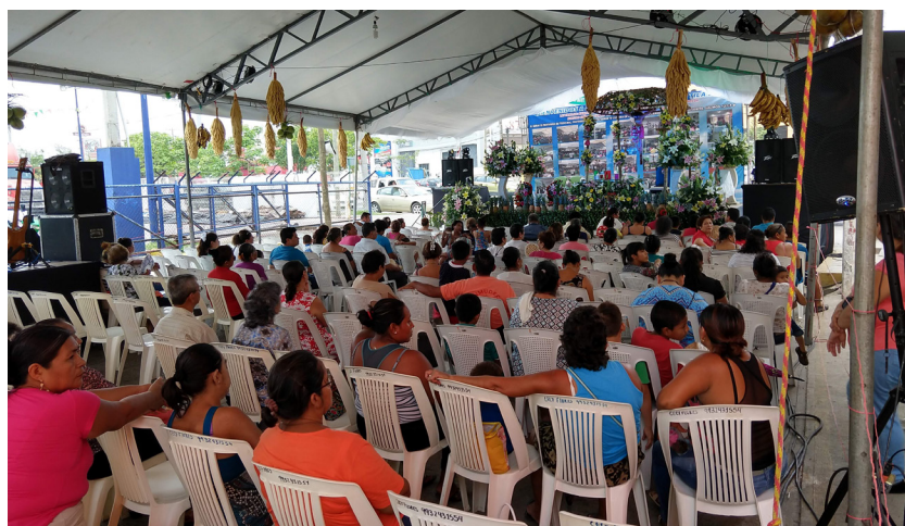
Figura 9. Rezos durante el cumplimiento de la promesa a San Judas Tadeo

Es importante mencionar que en algunas familias elaboran invitaciones para informar a sus conocidos que se llevará a cabo el rezo (Figura 9).