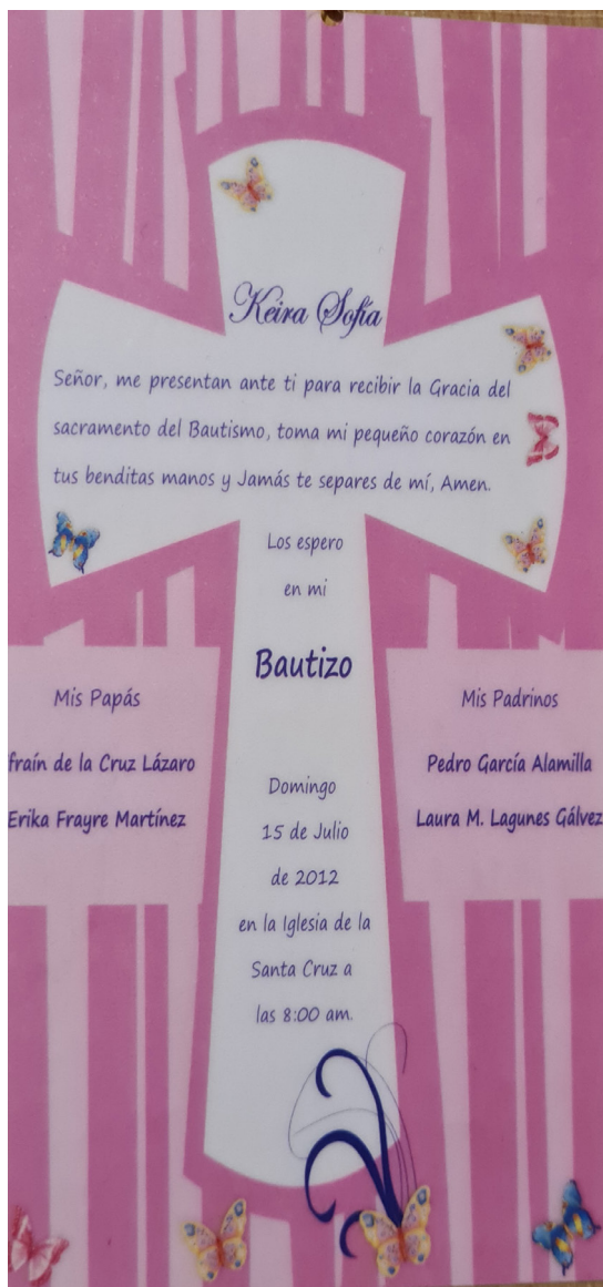
Figura 3. Invitación a bautizo