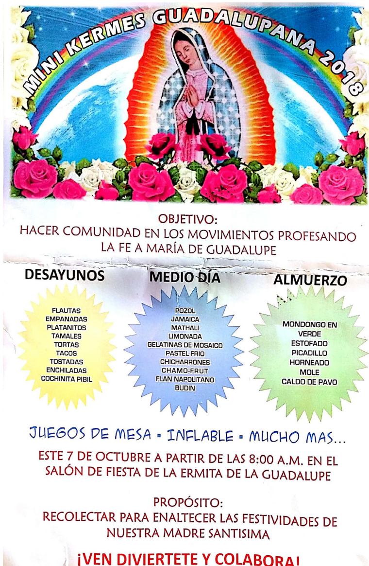
Figura 8. Invitación a la kermés para recaudar fondos en Jalpa de Méndez