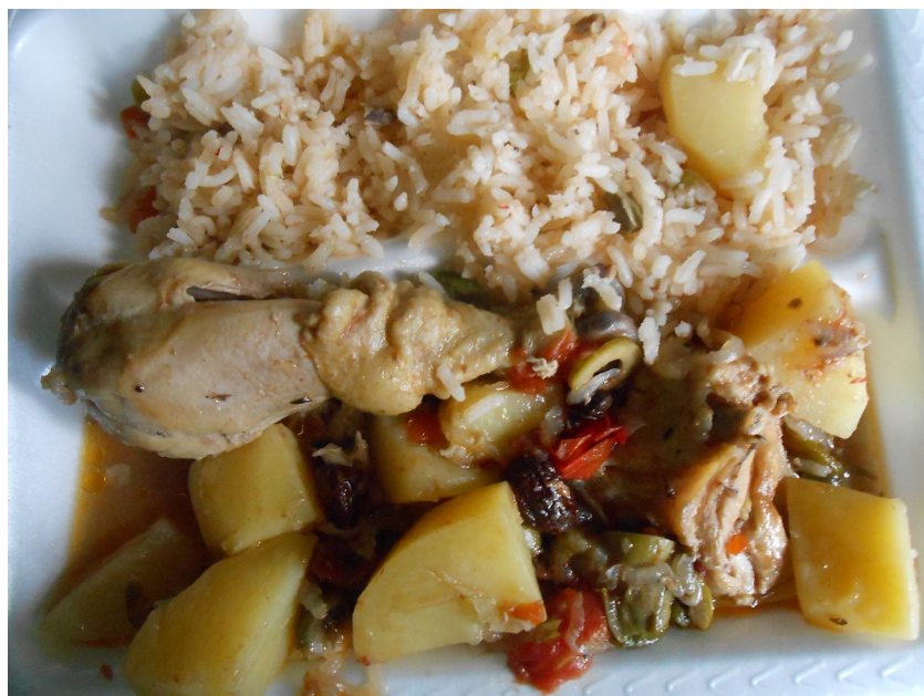
Figura 5. Altar y platillos ofrecidos durante el rezo de seis meses

de elote mezclados con manteca, azúcar y cocido en el horno o en las brasas.