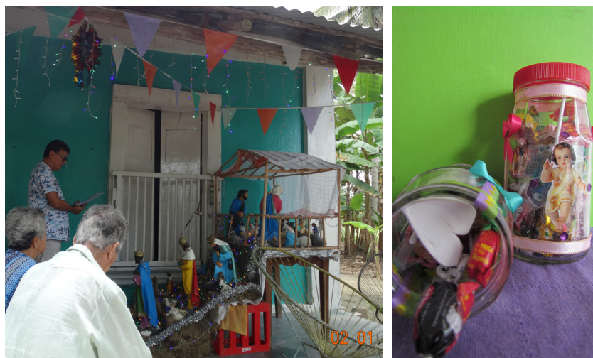
Figura 2. Aguinaldo ofrecido en el levantamiento del Niño Dios del nacimiento

Entre los platillos principales para los niños se encontraron los tamales (de chipilín, de caminito, de masa colada, con repollo, revueltos, torteados, manecas y chanchamitos), tacos, enchiladas, tortas, bocadillos, sándwich, hamburguesa y, para los adultos pozole, horneado, estofado, entre otros (anexo A). Entre los platillos emblemáticos para esta fiesta están el marquesote y la rosca de chocolate. Como bebidas ofrecen horchata, atole de masa con leche, chocolate, pozol, champurrado, refresco y café.