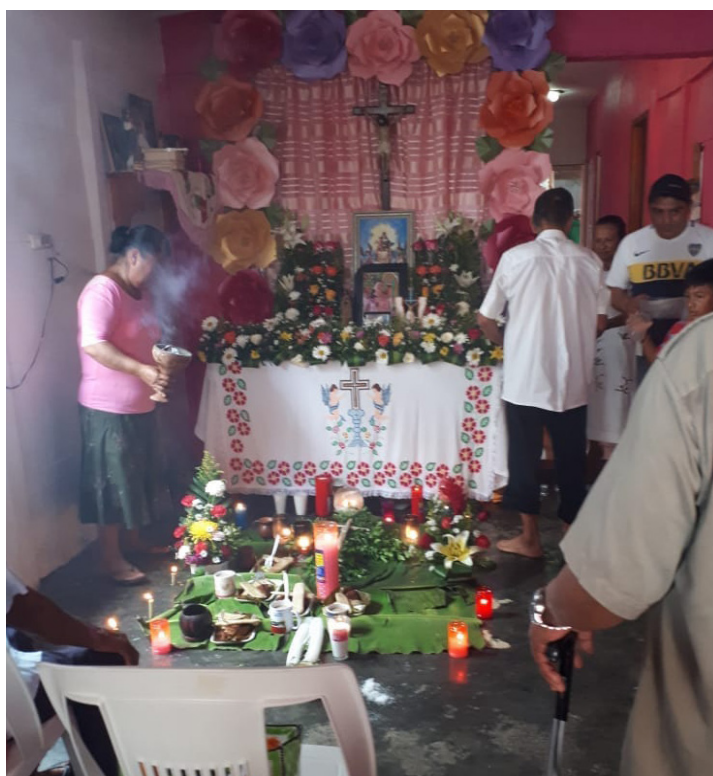
Figura 6. Altar para el cabo de año

por frecuencia fueron los tamales: de masa colada, de chipilín, de caminito, de maíz nuevo, manea de frijol y chanchamito. La segunda mención fue la de dulces regionales. La tercera, la barbacoa de res o pollo. En cuarto lugar, estofado, picadillo de menudencias de res, bistec de res a la mexicana o de hígado, tacos de guisados, galletas y pan; seguidos de puchero, carne polaca y espagueti. En cuanto a las bebidas fueron mencionados el café negro o con leche, atole y agua de jamaica.