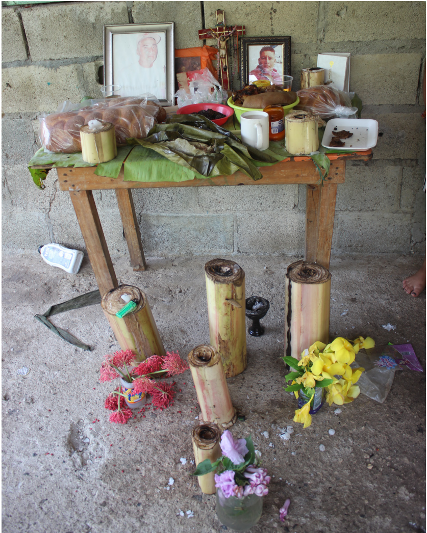
Figura 7. Tamales para el altar de muertos en Macuspana, Tabasco