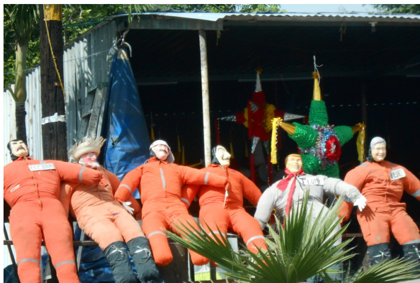
Figura 1. Muñecos alusivos al año viejo

En cuanto a la comida, se encontraron 56 platillos y siete bebidas. En el análisis realizado, en estas dos fiestas, tanto Navidad como Año Nuevo, comparten 22 platillos, entre ellos las frutas y las semillas (manzanas, uvas, nueces, pistaches, avellanas, entre otras), la cherna a la española que compite con el bacalao, el pavo a la galantina (que primero es deshuesado y relleno con su carne y otros ingredientes) y el borrego asado. Entre los postres: pan borracho, carlota, queso napolitano y pay (Cuadro 1).