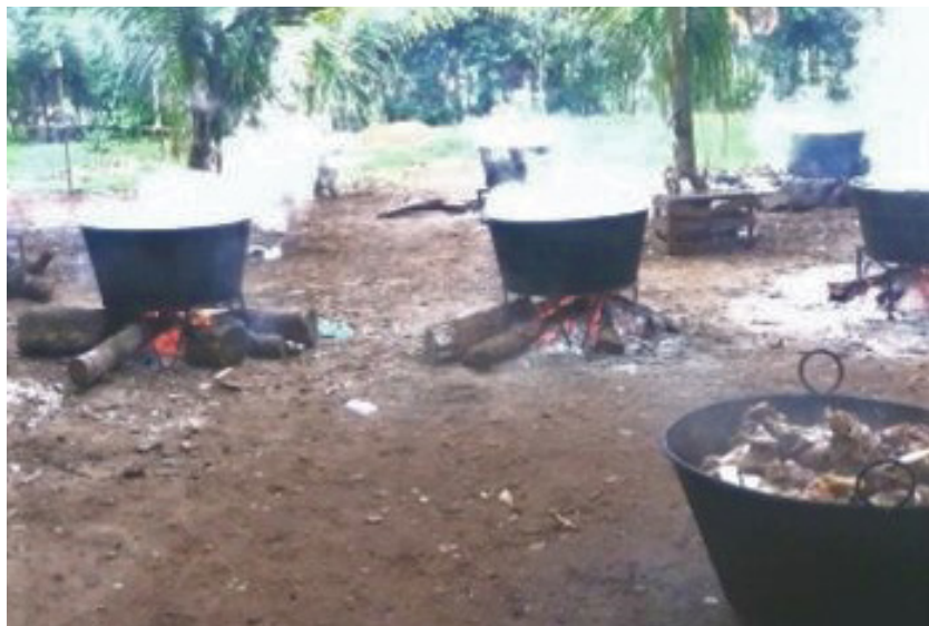
Figura 10. Preparación de los platillos para la promesa a la Virgen del Carmen

Una parte de cada uno de los productos elaborados (chicharrón, carne de cerdo sancochada, pozol, totoposte, tortillas de yuca y de maíz, sancochado de pavo, caldo de res o cerdo, un ave entera cocida, entre otros) se coloca como ofrenda en el altar conforme se van terminando. Después de que todas las personas comen, se juntan las piezas restantes y un representante de cada familia participante pasa con su recipiente para que le repartan carne, caldo y arroz para llevar a casa y lo comparta con las personas que no pudieron estar presentes.