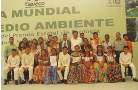
Foto 1. Los niños/ñas y integrantes de Mundo Sustentable mostrando la medalla y El Diploma que acredita el Premio Estatal de Ecología “José Narciso Rovirosa”

En los setenta la zona indígena Chontal fue el sitio donde se edificó un sistema de cultivo similar al de Xochimilco, pues se pensaba que los humedales reunían características para la “chinampa tropical”. Presentan diversos problemas socio-ambientales y de producción. Se persigue aplicar y evaluar un modelo de educación ambiental sobre el conocimiento del medio, la gestión ambiental; la producción agroecológica y la formación para la sustentabilidad mediante estrategias de participación de la base social. La base de trabajo es la investigación-acción-participativa e intervenciones de educación ambiental. Se ha realizado una presentación del proyecto ante autoridades. Taller de diagnóstico de problemas. Aplicación de cuestionarios, entrevistas y encuestas. Colecta de materiales biológicos; caracterización de la biodiversidad. Encuestas para determinación de indicadores de sustentabilidad y adaptación del marco de evaluación de sistemas de manejo y recursos naturales. Sistematización de datos y análisis estadístico y la preparación de actividades de educación ambiental. Como resultados se ha impulsado el modelo de educación ambiental para la sustentabilidad a partir de involucrar a toda la