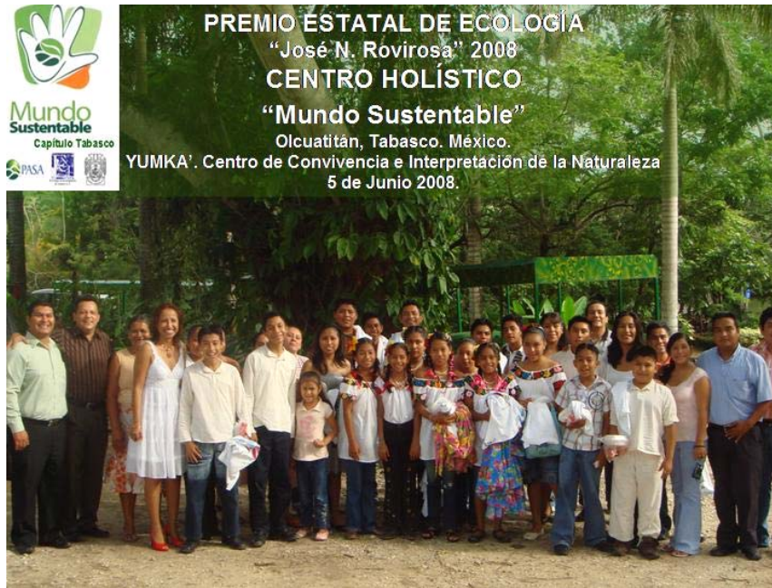
Foto 2. Foto oficial del grupo humano galardonado que trabaja impulsando la sustentabilidad en Tabasco con el pueblo Yokot' an (Chontales).

PALABRAS DE AGRADECIMIENTO POR EL PREMIO ESTATAL DE ECOLOGIA