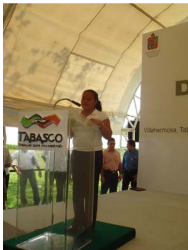
Foto 2. Lectora en representación del “Centro Holístico Mundo Sustentable”

AL CENTRO HOLISTICO MUNDO SUSTENTABLE DE OLCUATITÁN, NACAJUCA.